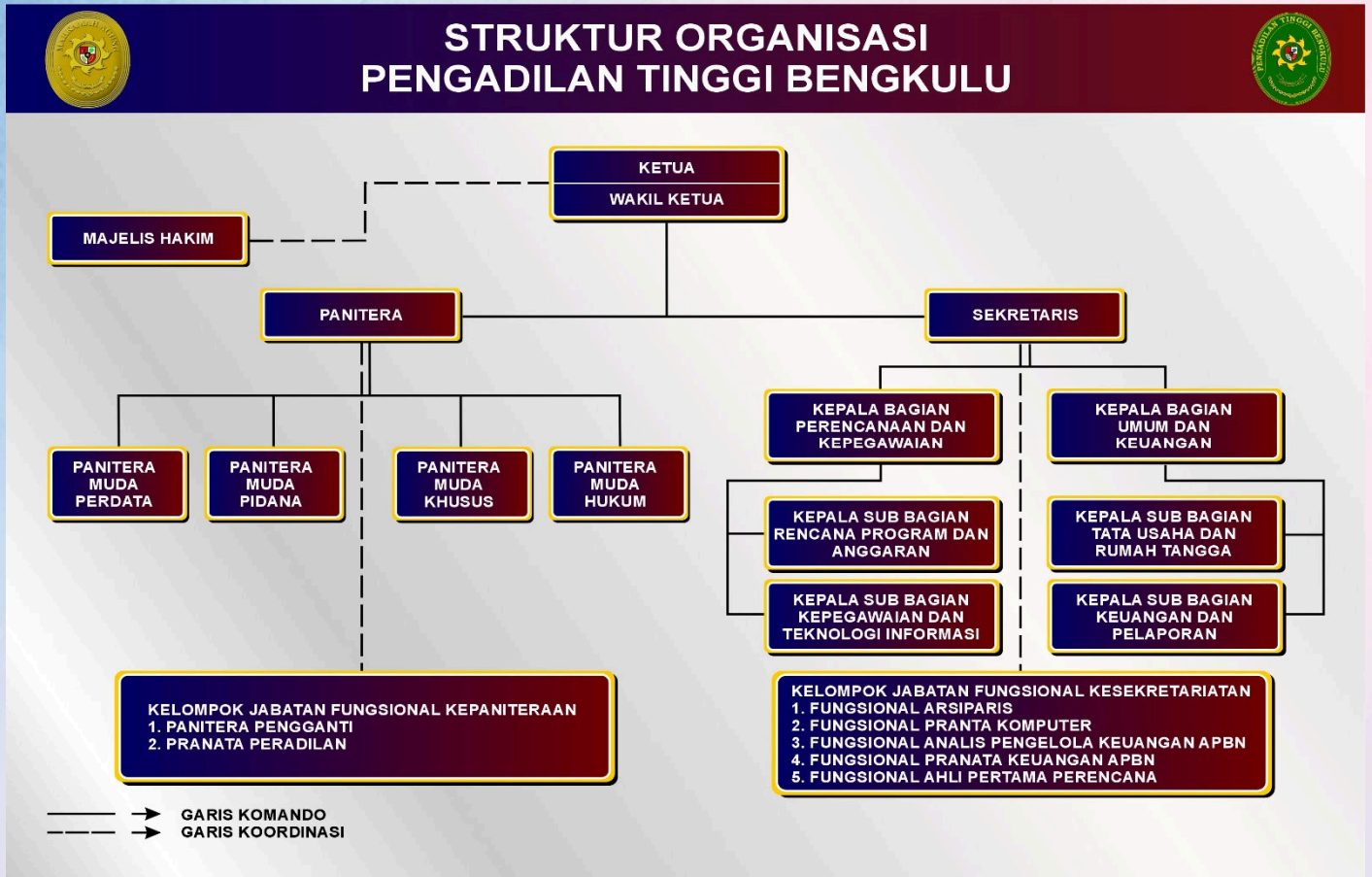
Gambar 4. Struktur Organisasi Pengadilan Tinggi Bengkulu