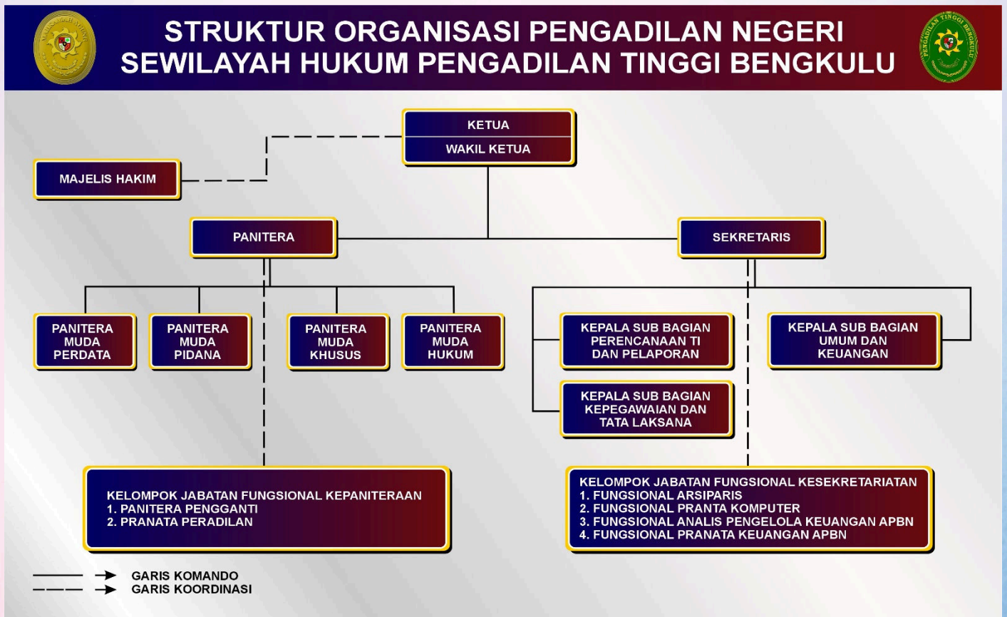
Gambar 5. Struktur Organisasi Pengadilan Negeri Sewilayah Hukum Pengadilan Tinggi Bengkulu